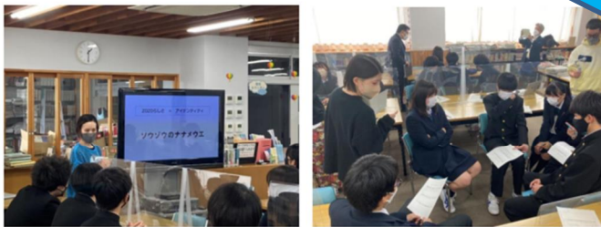
▲株式会社 ZOZO による講義 (左) 生徒の各グループに、株式会社 ZOZO のスタッフが議論の進行役として配置

「制服」を題材に、幅広く学校や会社といった「集団」の在り方について、「多様性」という観点から様々な活動に取り組んでいる株式会社 ZOZO の企業ブランディング部門職員を招聘した議論が、県教育委員会の仲介によって実現した。